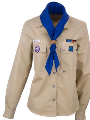
Kluftbluse mit Jupfihalstuch