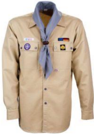
Klufthemd mit Leiterhalstuch

Die Kinder fragen sehr interessiert nach warum die Pfadis überhaupt ihre Kluft tragen. Kannst du ihm helfen diese Frage zu beantworten?